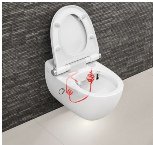
Langlebigkeit dank einzigartiger thermischer Reinigung des wasserführenden Systems mit 70°C heissem Wasser und der automatisierten Entkalkung des Gerätes.

Beim LaPreva P1 wird erst die Technischeinheit und dann die Keramik montiert. Da beim P2 die Technik in der Keramik versteckt ist, entfällt dieser Schritt. Die neue, patentierte Klick-Montage-