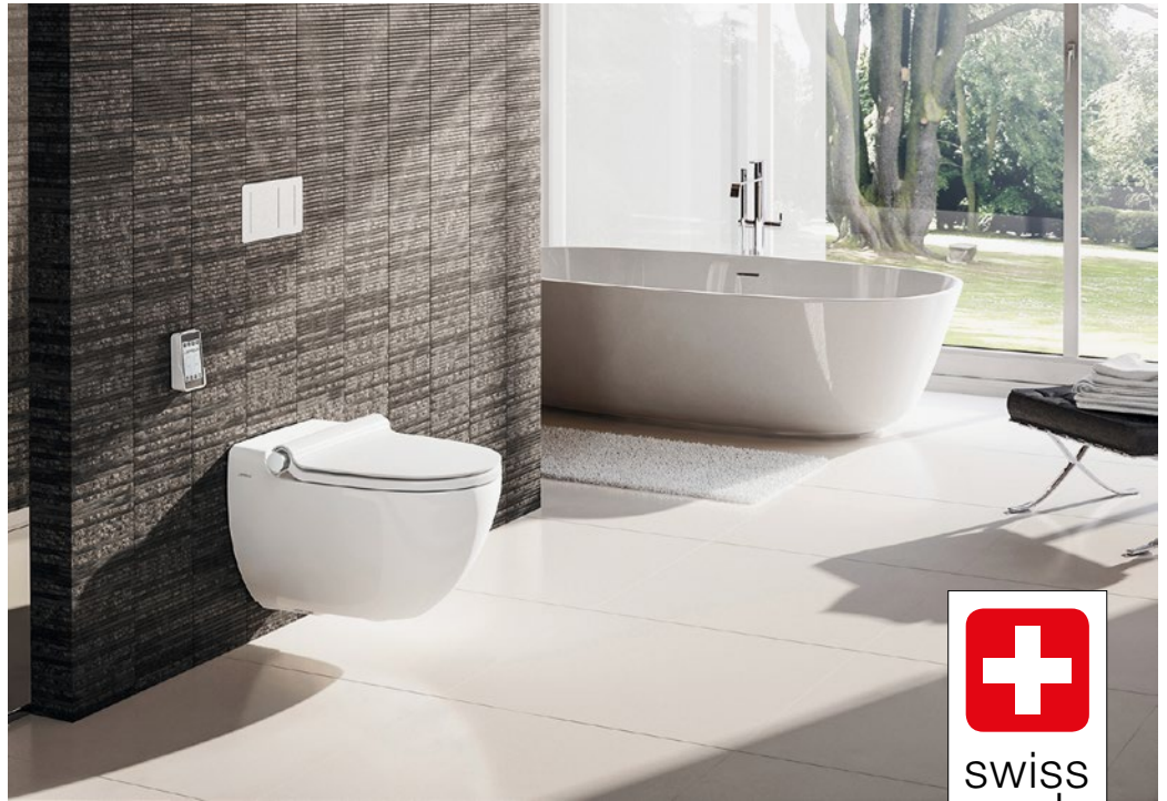
LaPreva P2 Dusch-WC wird entwickelt und produziert in der Schweiz.

Das angepasste Vertriebssystem wurde von den Installateuren sehr gut angenommen. Das Rabattierungssystem ist in dieser Branche üblich und ermöglicht eine ge-