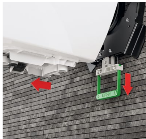
Revolutionäre Klick-Montage beim LaPreva P2 Dusch-WC, über die sich Monteure wie Besitzer gleichermaßen freuen.