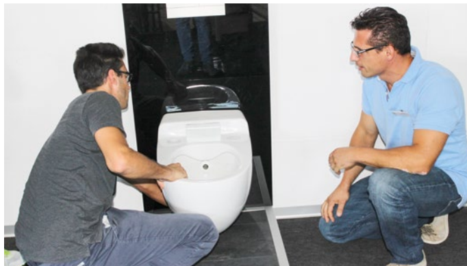
Selber Hand anlegen: die Installateure konnten sich selber von der Einfachheit überzeugen, das neue LaPreva P2 zu montieren.