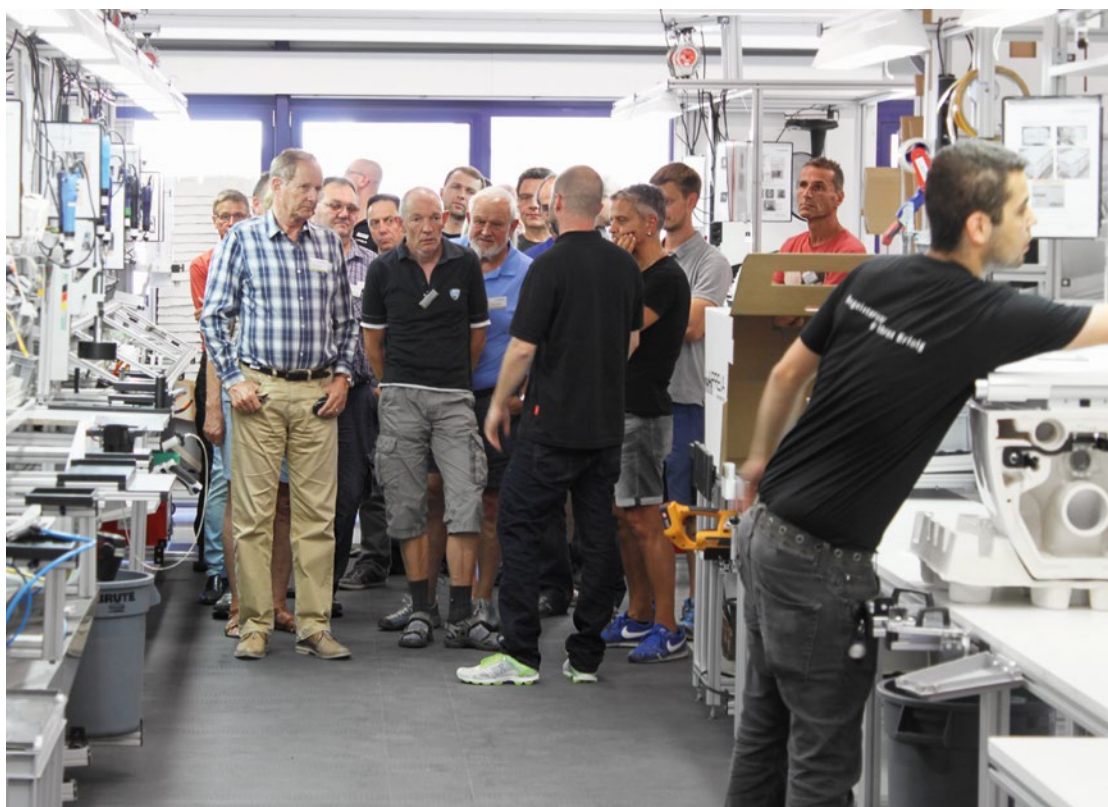
Produktionslinie des LaPreva P1: Einleitung in die Prinzipien der Lean Production.