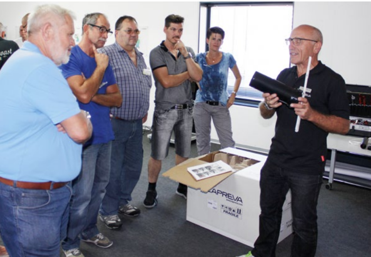
Wichtige Basics gehen gerne vergessen: Bei der Montageschulung bei LaPreva wurde bewusst auch auf grundlegendes Wissen hingewiesen.