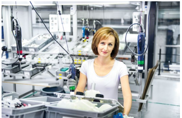
... und die moderne Produktion...