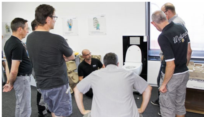
Montageschulung in drei Gruppen: interessierte Sanitärinstallateure liessen sich die clevere Klick-Montage in rund 30 Minuten erklären.