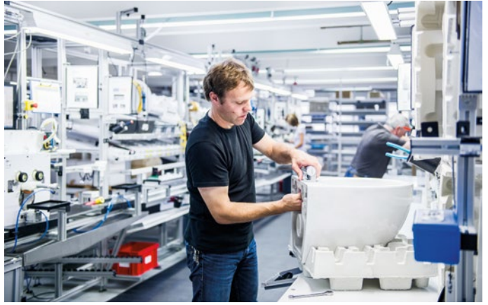
Auf dem Rundgang bei Noventa konnten die Teilnehmer wertvolle Einblicke gewinnen...